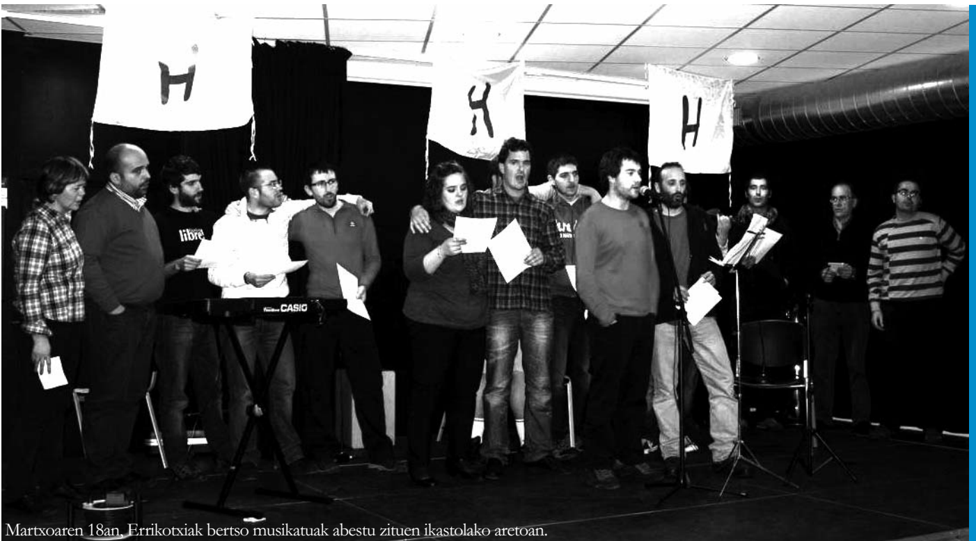
Martxoaren 18an, Errikotxiak bertso musikatuak abestu zituen ikastolako aretoan.