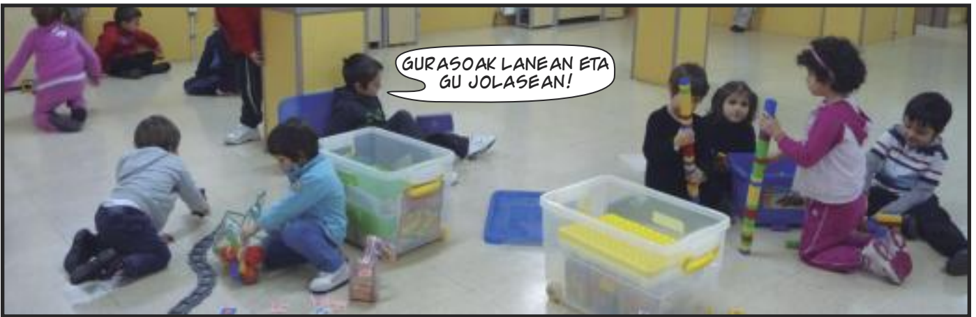
GURASOAK LANEAN ETA GU JOLASEAN!