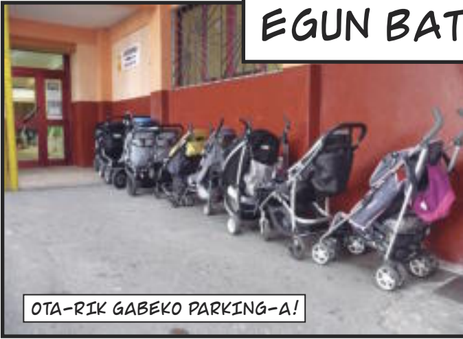
OTA-RIK GABEKO PARKING-A!