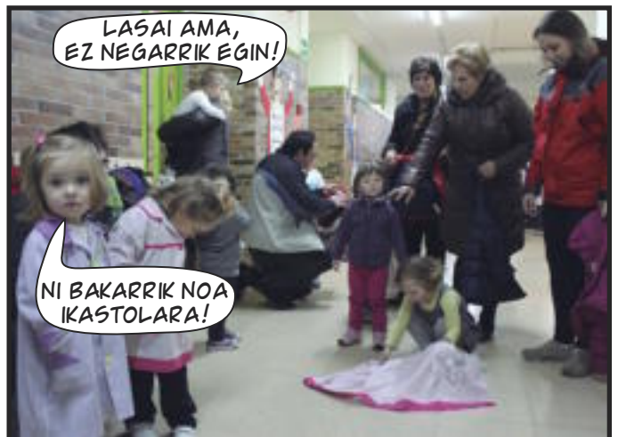
LASAI AMA, EZ NEGARRIK EGIN!