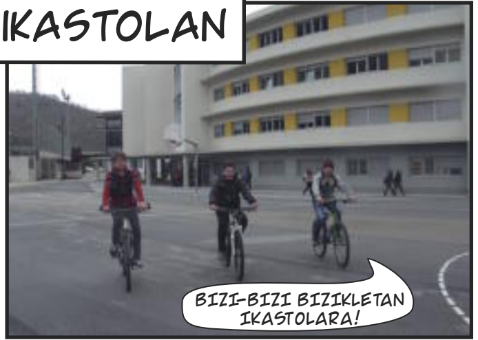
BIZI-BIZI BIZIKLETAN IKASTOLARA!