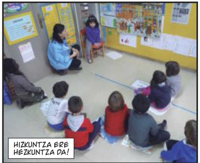
HIZKUNTZA ERE HEZKUNTZA DA!